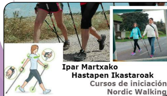
Ipar Martxako Hastapen Ikastaroak Cursos de iniciación Nordic Walking

Kirol hau ezagutu nahi baduzu, maiatzaren 28an, denboraldi amaierako festan, Lasarte-Oriako instruktoreak eta ipar martxako talde bat Loidibarrenen egongo gara, beraz gerturatu eta disfrutatu.