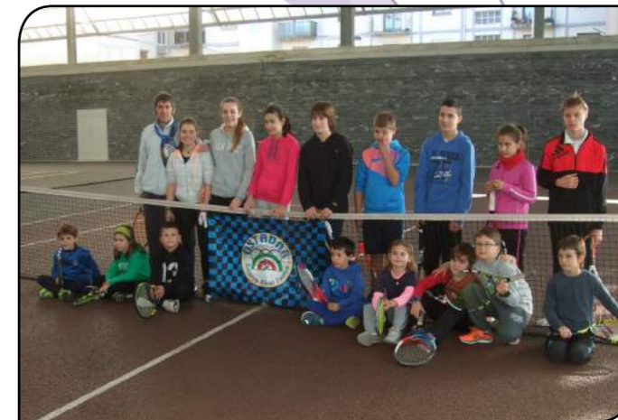
narentzat Tenis Eskolako atea zabalk daudela!

Honengatik guztiarengatik eta ohiturei eutsiz, ekainean denboraldiari amaiera emango diogu Tenis Jaiarekin. Bertan, tenis familiako kide guztiak elkartuko gara azken raketazoak jotzeko. Gogoratu, lehen urratsak eman ala sakondu nahi du-