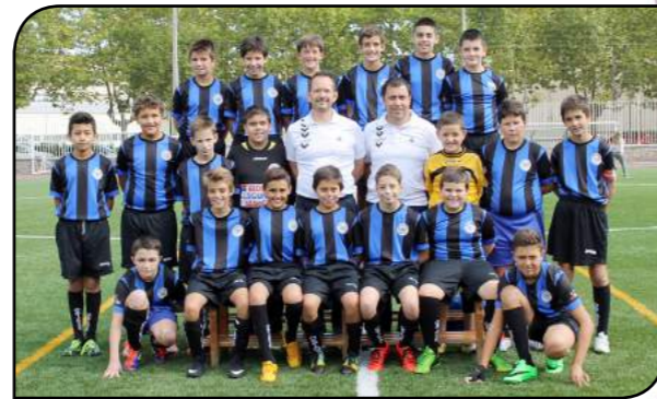
Infantil txikia B