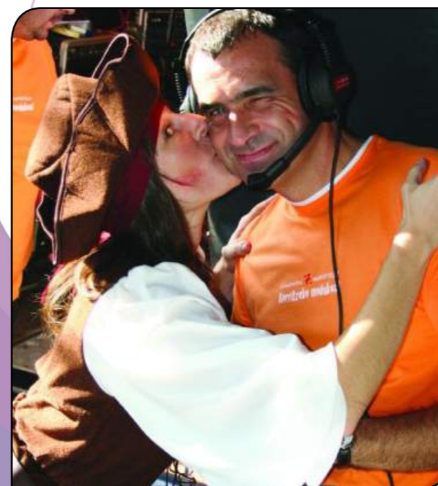
Argazkia: Euskararen Maratoia

Aurten erraza izan da sariduna auke-aratzea, Maratoia urtea baita! 1986an hasi eta lau urtez behin egiten den euskararen jaia da. Ttakunek dinamizatu eta Udaleko Euskarako Batzordeak baliabideak jartzen dituen arren, "Euskararen Maratoia, bere printzipio nagusiei jarraituz, lasarteoriatarrek egiten dute". 40 orduz, etenik gabe, zortzikote batek herriko plazan dinamizatzen duen jai hau auzolanean egiten da. Herriko elkarte eta herritarrek parte hartzen dute: elkarte gastronomikoak, kirol elkarteak, abesbatzak, musika eskolak, ikastetxeak, euskaltegiak, auzo-elkarteak... "Euskararen Maratoia, Lasarte-Oriako herritarrak gara".